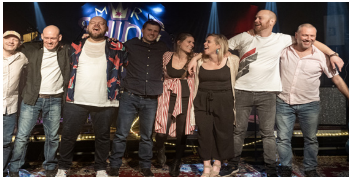
Mr. Swing King gæster Kroen fredag den 1. april

præget af farens vrede. Hun spørger: Hvorfra kom hans vrede? Og hvorfor skulle den familie, som hun voksede op i, ende med at ødelægges fuldstændigt? Hun går på opdagelse i historierne fra sin jugoslaviske familie, som er fyldt med folk, der slår ihjel eller selv bliver slået ihjel, og en af disse myrdede er hendes far opkaldt efter. I hendes danske familie er der tilsyneladende aldrig sket noget, men også her opdager hun en erfaring med rædsel. Det hele bliver sat i perspektiv, da hun selv er forfatter og en af det frie ords forfægtere, da terroren rammer Danmark.