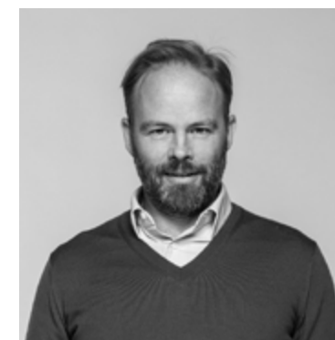
Solist Søren Hossy