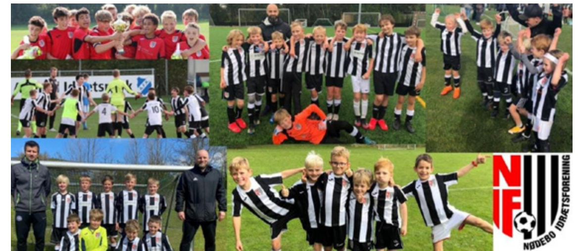
Nødebo Fodboldklub bygger på værdierne: Glæde, Fodbold for alle, Engagement, Udvikling & Fællesskab!