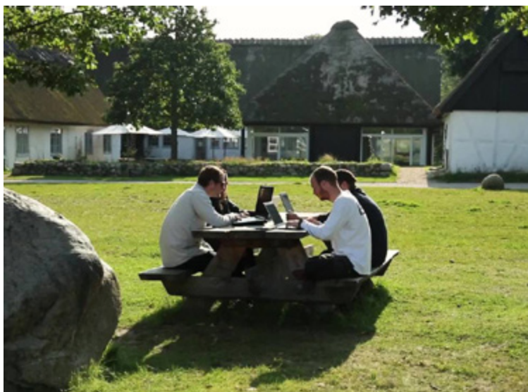
Studerende foran Skovskolen, der ligger i Nødebo.

Skovskolen er en del af Københavns Universitet og samtidig en af de største arbejdspladser i Nødebo og Gadevang med 64 ansatte på Skovskolen i Nødebo.