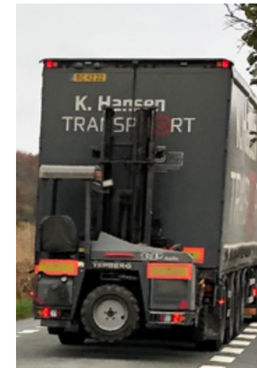
Vi skal have mindre tung trafik i Nødebo