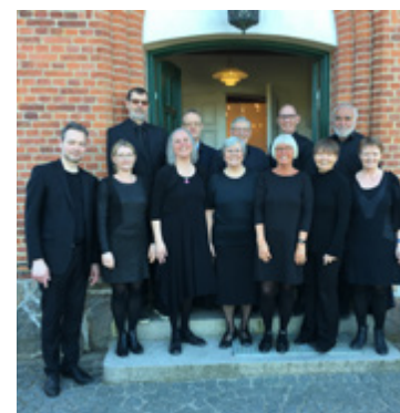
Nødebo-Gadevang kirkers Kantori

Vandringen til Emmaus. To rådvilde disciple på vej. Påsken sender os videre. Vi har en vej at gå, og imens vi går, har vi fået noget at tale om. For mysteriet er nødt til at åbne sig for os, igen og igen.