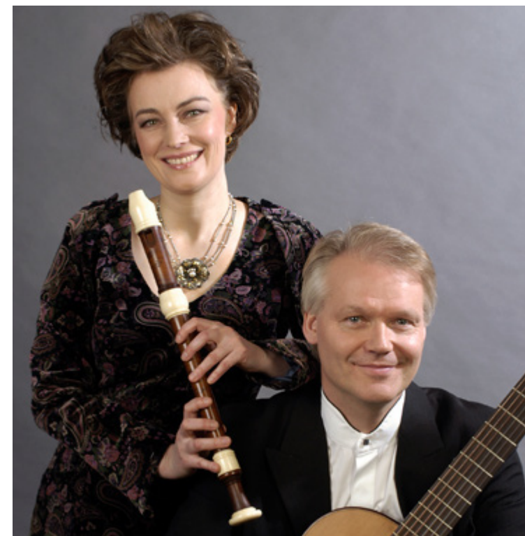
Petri/Hannibal Duo giver koncert den 3. april.