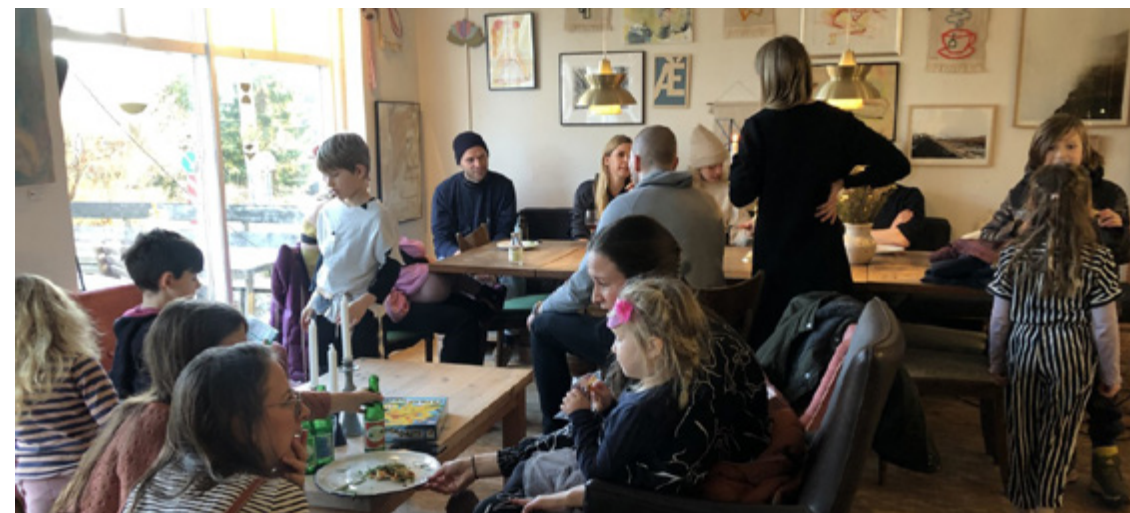
Fredagsbar i Jordnær.

Efter en lille coronapause er der igen masser af herlige Jordnær-arrangementer på programmet. Husk for eksempel at sætte kryds