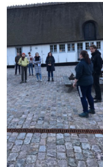
Studerende på Skovskolen.